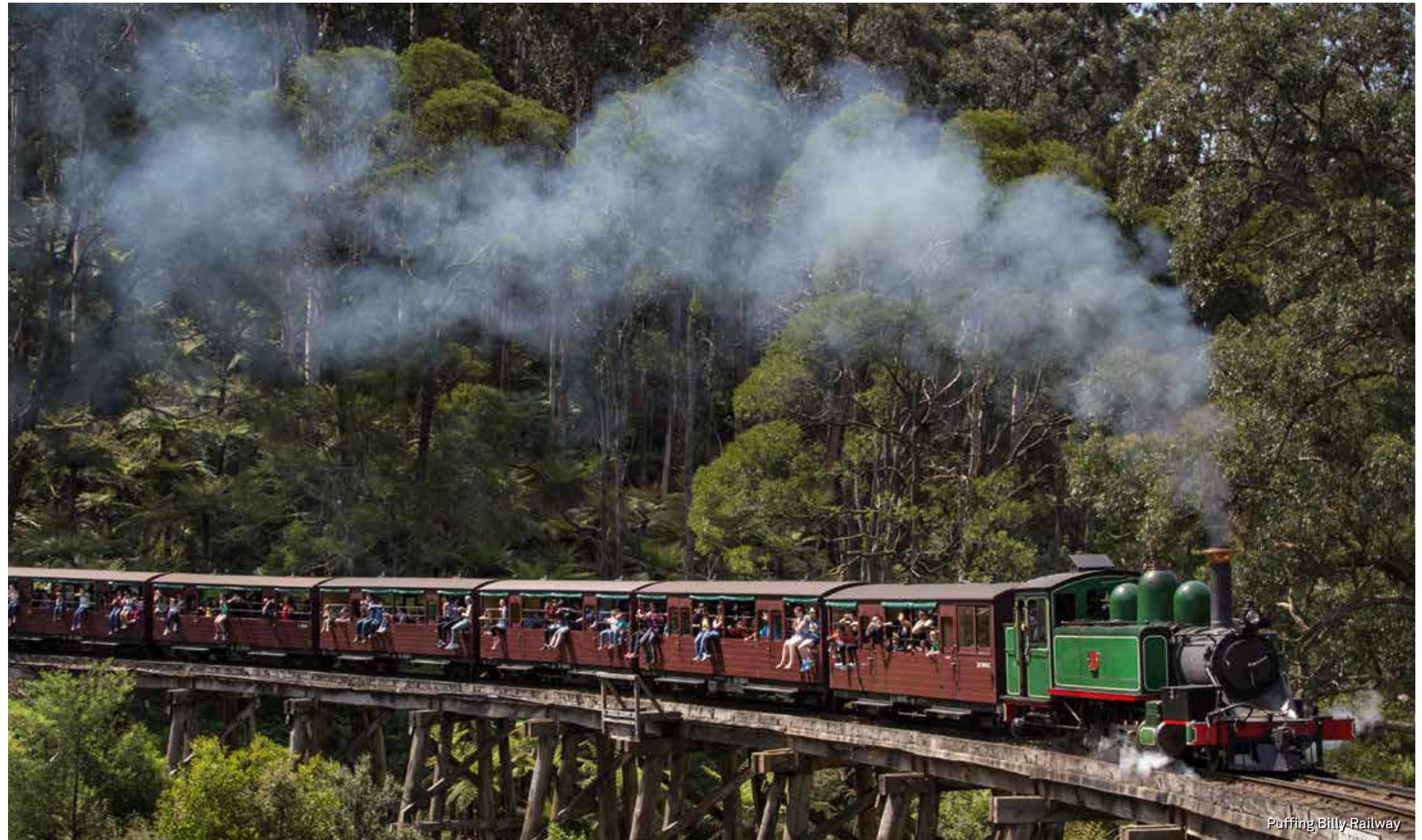
Puffing Billy Railway