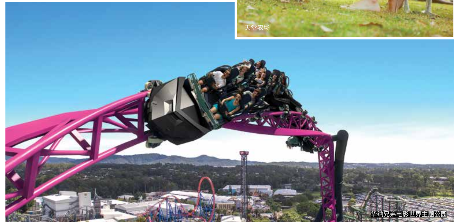
华纳兄弟电影世界主题公园