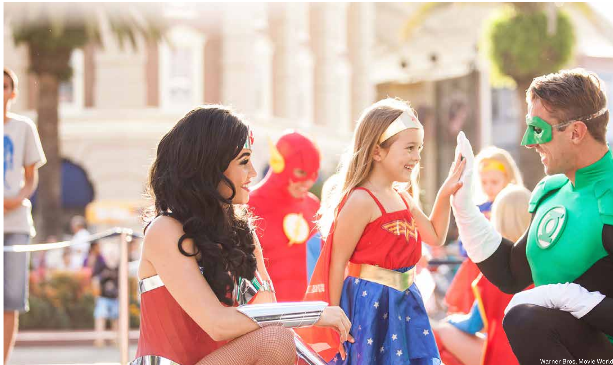
Warner Bros. Movie World