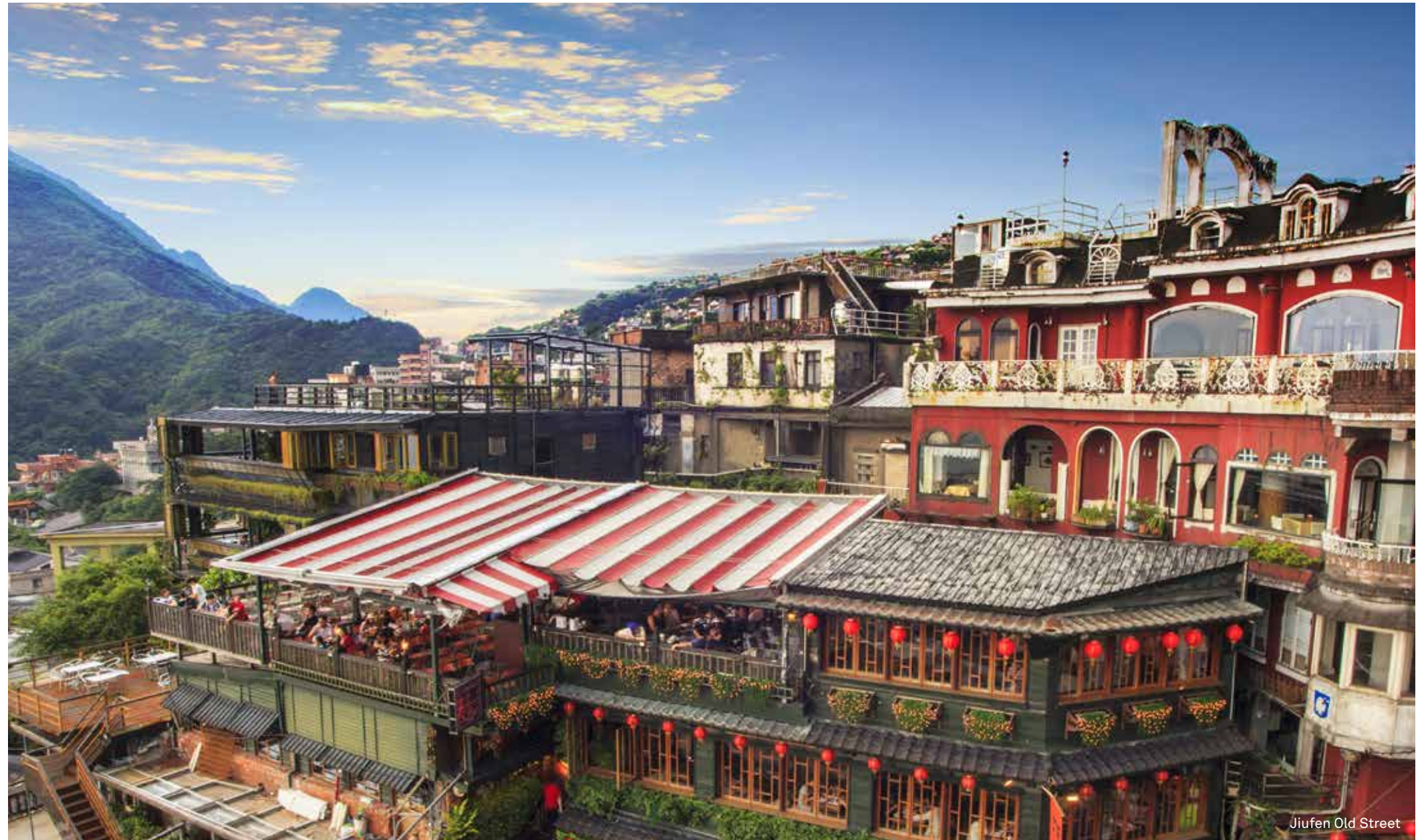
Jiufen Old Street